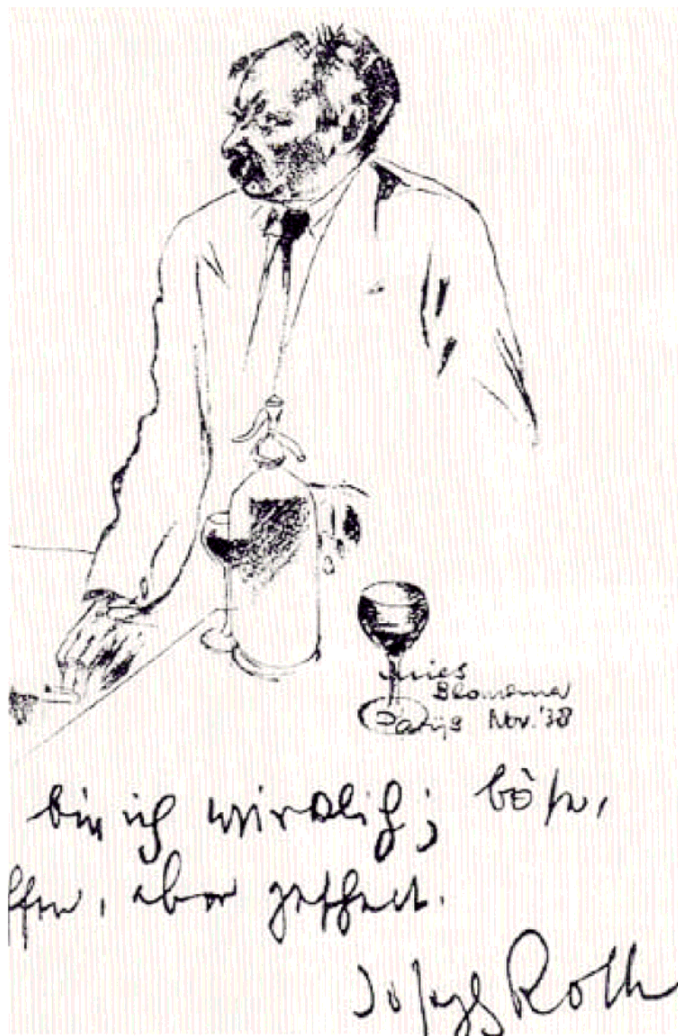
“Ecco quel che sono veramente - Cattivo, sbronzato, ma in gamba”, Joseph Roth a Parigi nel novembre 1938

L'anno è il 1934, il nazismo è saldamente al potere, la “peste bruna” è destinata a diffondersi per l'Europa e Roth ha appena intrapreso la via dell'esilio. Il narratore/reporter immagina quindi uno scenario solo all'apparenza distopico o apocalittico: il cosiddetto “Signore delle mille lingue”, un magnate proprie-