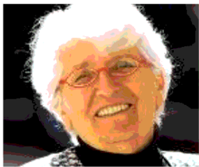
di Nicoletta Sipos