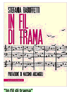
"In fil di trama"