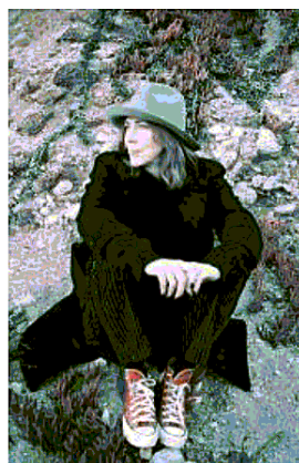
Attesa per i concerti di Patti Smith (foto sopra), Max Gazzè e Beth Orton