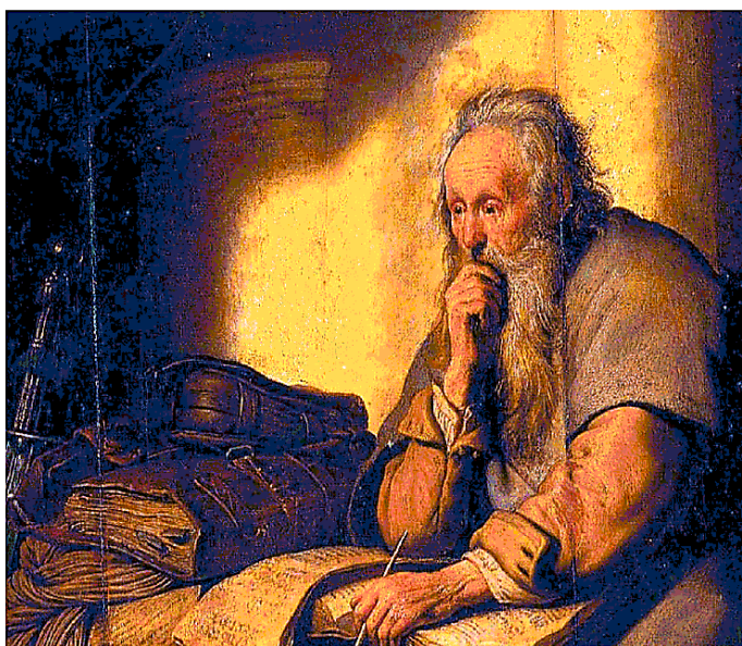
"L'apostolo Paolo in carcere", del 1627, opera di Rembrandt

Sette settimane erano trascorse dalla crocifissione di Yeshua ben Yoseph, il rabbi di Nazareth. A Gerusalemme accorrevano folle di pellegrini per la festa ebraica di Shavuot. Ma l'atmosfera non era gioiosa. I poveri, i senzateo, i derelitti, non avevano più una guida. Eppure quel giorno, nel cortile del Tempio, un gruppo di galilei attirò l'attenzione di tutti. A parlare era un pescatore di Cafarnaon. Diceva che il Messia non era stato sconfitto – anzi era risorto. Tra coloro che lo ascoltavano c'era anche Shaul, figlio di Baruch, un giovane di Tarso, in Cilicia. Aveva trascorso l'adolescenza chino sulla Torah, sui libri dei salmi e dei profeti. Ma nella sua città si sentiva sprofondare in un oceano di paganesimo, tra avidità e dissolutezza. Che il Messia promesso a Israele avrebbe liberato anche gli altri popoli cambiando l'intero ordine del mondo? Ne era certo. Non si unì agli esseni che abitavano nel deserto; scelse invece di essere nazireo, sottoponendosi a una severa disciplina. A Gerusalemme si sentì presto a casa. Tra quelle vie tumultuose spirava il vento della rivolta da quando Israele era sotto la spada di Edom, l'Impero romano. Fariseo, figlio di farisei, Shaul non poteva accettare che il Giusto di Galilea fosse il Mashiah che gli ebrei aspettavano. Non mancavano i segnali di un grande rivolgimento: i gentili