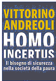
VITTORINO ANDREOLI Homo incertus Rizzoli, pagine 360, euro 18,50

comunità, perché mettere in comune conoscenze e abilità mitiga l'incertezza. È ricco di stimoli il saggio «Città di paure, città di speranze» di Zygmunt Bauman (riproposto da Castelvecchi), che analizza le traiettorie delle nevrosi contemporanee. Spiega come smontare «La paura delle malattie» (Ponte alle Grazie) il testo attualissimo degli psicologi e psicoterapeuti