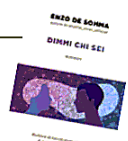
ENZO DE SOMMA Dimmi chi sei Sperling & Kupfer, pagine 208, euro 15,90

da silenzi e poesie, che si consuma in 24 ore, in uno spazio rarefatto, sospeso, a metà tra realtà e sogno.