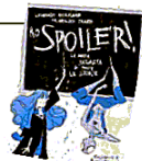
PATRIGNANI, TRENTO, INNOCENTE No spoiler! La mappa segreta di tutte le storie De Agostini, pagine 192, euro 15,90

alla scoperta degli elementi comuni alle narrazioni più efficaci e svelano i segreti per costruirne bene il proprio racconto (anche sui social).