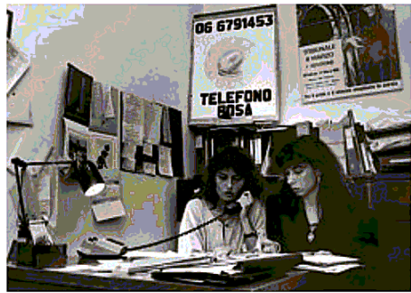
Archivio il primo anniversario di Telefono rosa

Al Museo Madre si parla d'amore, in ogni sua forma. Dalle quelle molteplici dell'eros che oggi alle 17, in occasione di San Faustino protettore dei single, verranno esplorate attraverso una visita tematica alla mostra di Robert Mapplethorpe: dai ritratti delle due «muse» mapplethorpiane, Patti Smith e Samuel Wagstaff Jr, alla sua perenne oscillazione tra idealità apollinea e sensualità dionisiaca, per poi terminare con un aperitivo/speed date dedicato agli appassionati d'arte. Domani alle 11, invece, prosegue il viaggio immersivo nelle 160 opere del celebre fotografo statunitense.