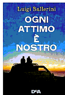
LUIGI BALLERINI Ogni attimo è nostro De Agostini, pagine 250, euro 14,90

network, non immaginano quanto sia fragile quella condizione, e neppure che davvero, all'improvviso, «tutto può finire». La storia narrata dalla youtuber diciottenne Sofia Viscardi in «Abbastanza» (Mondadori) procede «con la velocità e la leggerezza di una foglia gialla che si stacca da un albero e si appoggia al suolo»: «In ordine sparso», come in un film, segue le vicende di