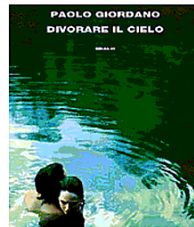
PAOLO GIORDANO Divorare il cielo Einaudi, pagine 430, euro 22

La materia che lo scrittore tratta è intricata, ricca, densa e scivolosa. Parte dalla giovinezza di Teresa, una quattordicenne torinese che ogni estate torna a Speciale per le vacanze nella villa della nonna. Lì accanto c'è una masseria dove abita una coppia con tre ragazzi, più o meno della sua età: soltanto uno, Nicola, è loro figlio naturale, gli altri due, Bern e Tommaso, sono stati adottati. Teresa si aggiunge questo bizzarro gruppo familiare per curiosità, per caso e per gioco. È catturata dal fascino inquieto di Bern, che diventerà il suo più grande amore. I protagonisti attraversano l'adolescenza negli Anni Novanta - come è accaduto allo