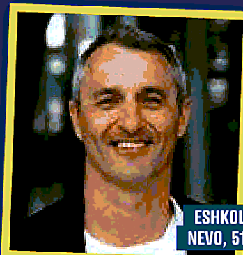
ESHKOL NEVO, 51