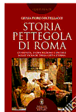
Copertina «Storia pettegola di Roma» (Newton Compton, 384 pagine, 12,90 euro) di Giulia Fiore Coltellacci A destra un ritratto della «Pimpaccia»