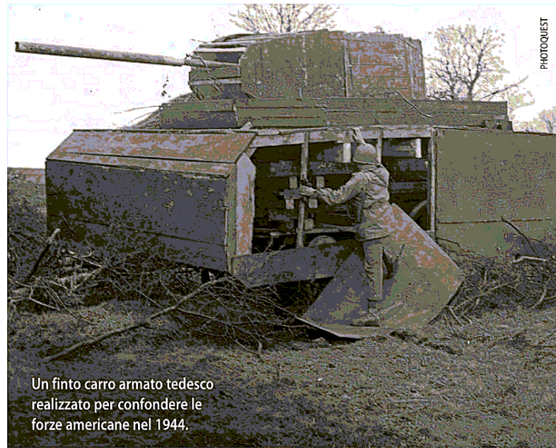
Un finto carro armato tedesco realizzato per confondere le forze americane nel 1944.

più sofisticati prodotti si scorgono crepe che tradiscono anche il più abile dei falsari. Nella "storia falsa" sono raccolti esempi clamorosi di doppi giochi per deviare il corso della lotta politica: dall'inverosimile lettera di Pausania spartano al re di Persia, ai discorsi che si leggono nelle Storie di Tucide, alla lettera di Bruto fatta passare per falsa, al celebre "testamento" di Lenin, inghiottito per anni dalla macchina di partito.