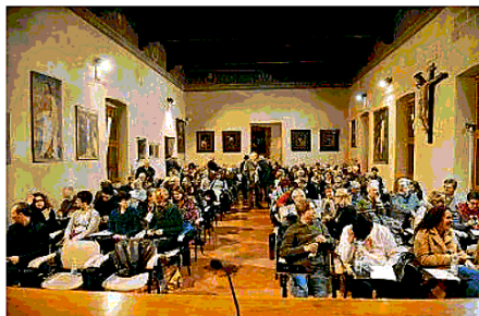
Alla Pace. Il salone Bevilacqua gremito per la Ccdc

ne dei migranti orchestrata dall'Unione europea. Non si parla mai di futuro, felicità, progresso, giustizia, ma solo di un'azione di difesa contro il nemico».