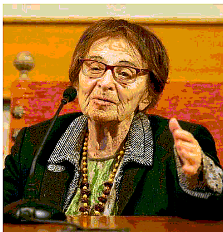
L'appello. «Ci vuole uno sforzo collettivo»

zione è formata da un singolo gruppo etnico entra in contraddizione con la natura onnicomprensiva del diritto di cittadinanza, e prepara l'avvento del razzismo. L'etnonazionalismo propaga l'ideologia dell'odio e del nemico, la sua ideologia è quella del tiranno che sconfigge il male. Orbàn si spaccia per il difensore degli ungheresi dall'invasio-