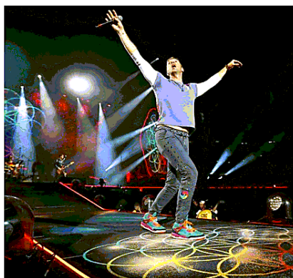
Sopra Bruce Springsteen A sinistra Chris Martin, frontman dei Coldplay che celebrano il tour di A Head Full Of Dreams con la pubblicazione di Live In Buenos Aires / Live In 500 Paulo / A Head Full Of Dreams (Film) e Renato Zero nella copertina di Alt in tour

che continua a festeggiare anniversari, e così festeggia i 40 anni del primo album...Ma cosa vuoi che sia una canzone... La ristampa inaugura anche la serie R>Play di Sony Music, per i quarantenni. I Coldplay celebrano il tour di A Head Full Of Dreams (che ha infranto ogni record di presenze) con la pubblicazione di Live In Buenos Aires / Live In 500 Paulo / A Head Full Of