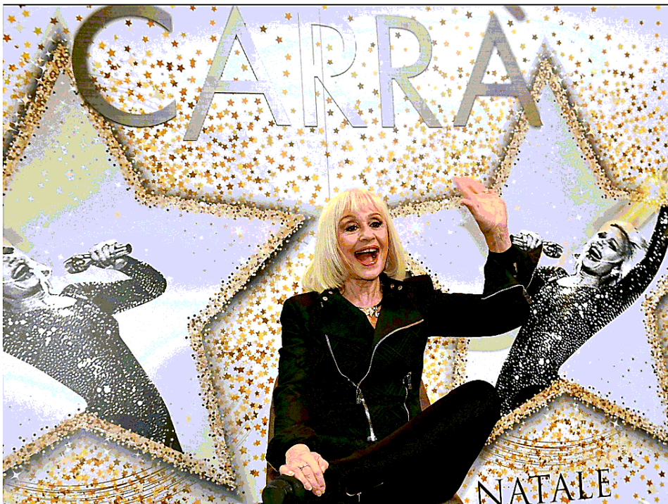
Raffaella Carrà alla presentazione di Ogni volta che è Natale, uscito dopo cinque anni di assenza dalle scene musicali dell'artista