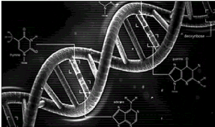
Riproduzione della struttura del dna