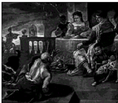
Luca Giordano, «Il ricco Epulone» (XVII secolo)