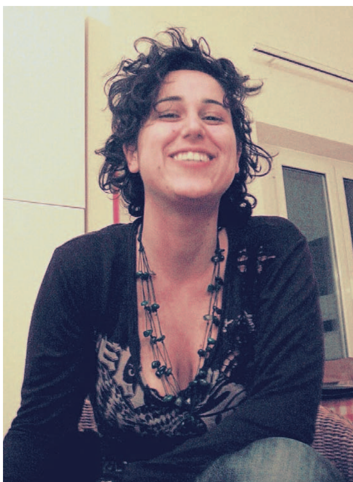
Dopo l'esordio in libreria, Pulsatilla curerà una rubrica su «Cosmopolitan»

«E' per il narcisismo il corrispondente metaforico del punto G: si può solleticare e non aspettare altro che di vedere l'ego compiaciuto».